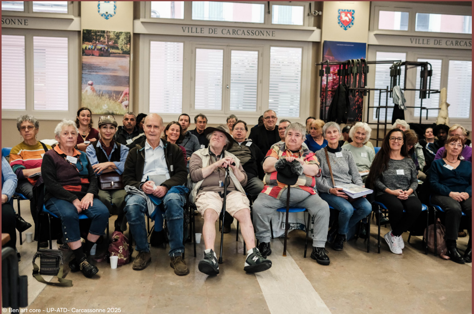
© Ben art core - UP-ATD- Carcassonne 2025